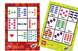
کارت‌های آموزش اعداد جمع اعداد کارت‌های آموزش اعداد

ابتدا کارت‌های بازی رو خوب بُر بزیند. به هر بازیکن یک کارت بدهید. نکته: کارت‌ها به صورت دو رو است. در طرف سبز کارت، قرار است اعداد انگلیسی و شمارش اعداد به صورت صحیح را یاد بگیریم، به همین جهت در قسمت سبز رنگ کارت، تصاویر همراه با کلمه‌ای که نشانگر تعداد اشکال در آن تصویر هست را نشان می‌دهد. اما در طرف قرمز کارت، قرار است عملیات جمع را تمرین کنیم، به همین جهت معادلات کوچکی همراه با تصویر در آن قرار دارد.