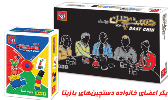
دیگر اعضای خانواده دستچین‌های بازیها